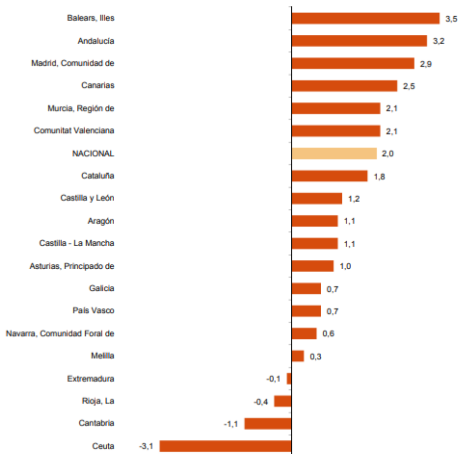
Indices generales: nacional y por comunidades y ciudades autónomas Abril 2019. Tasa anual de ventas. Porcentaje

Illes Balears (3,5%), Andalucía (3,2%) y Comunidad de Madrid (2,9%) registran los mayores aumentos. Por su parte, los descensos se dan en Cantabria (-1,1%), La Rioja (-0,4%) y Extremadura (-0,1%).