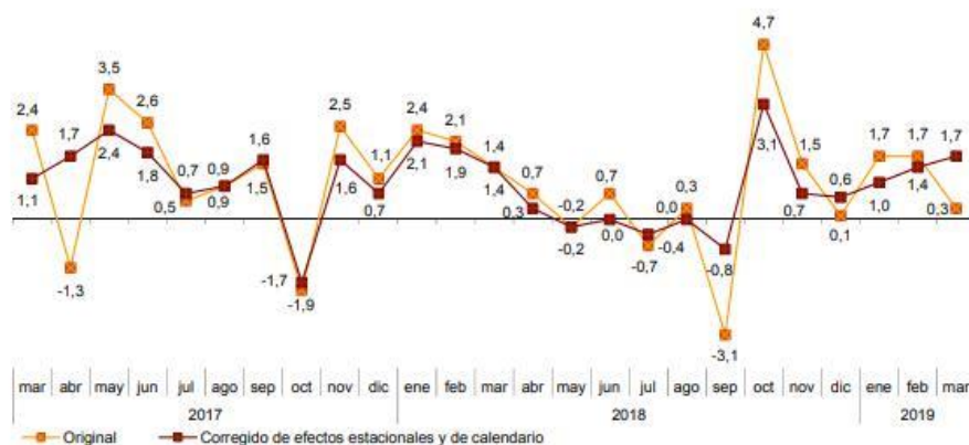
Índice General del Comercio Minorista a precios constantes Tasa anual. Porcentaje

Para tu conocimiento e información, te comunico que, de acuerdo con los datos publicados por el Instituto Nacional de Estadística sobre el Índice de Comercio al por Menor (ICM), la serie original del ICM a precios constantes registró en marzo una variación interanual de las ventas del 0,3% respecto a marzo de 2018 , lo que supone 1,4 puntos por debajo de la tasa del mes anterior.